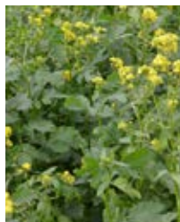
Gele mosterd (BCA-2)